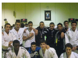
Les deux équipes Juniors