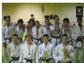
Les deux équipes Cadets